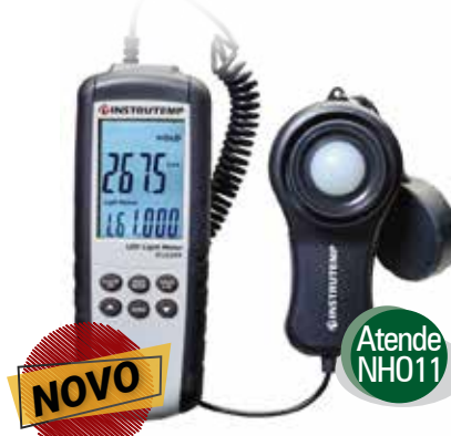
Luxímetro Digital 400000 LUX ITLD280