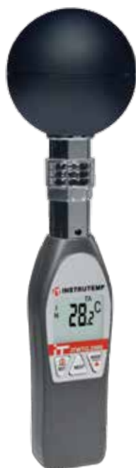
Termômetro de Globo Portátil ITWTG2000