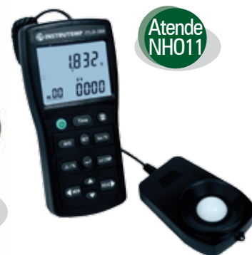
Luxímetro com Datalogger 999999 LUX ITLD300