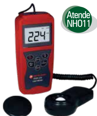
Luxímetro Digital 200000 LUX ITLD270