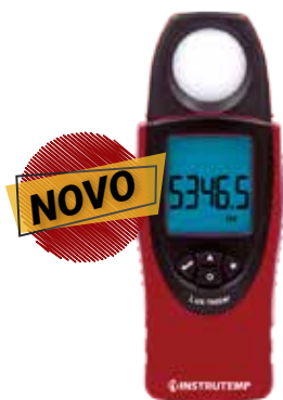
Luxímetro Digital 30000 LUX ITLD265

Nota: a NH011 foi atualizada, onde se faz necessário a medição de luz LED.